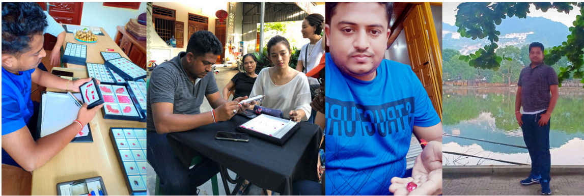
GEM EXPEDITIONS IN VIETNAM