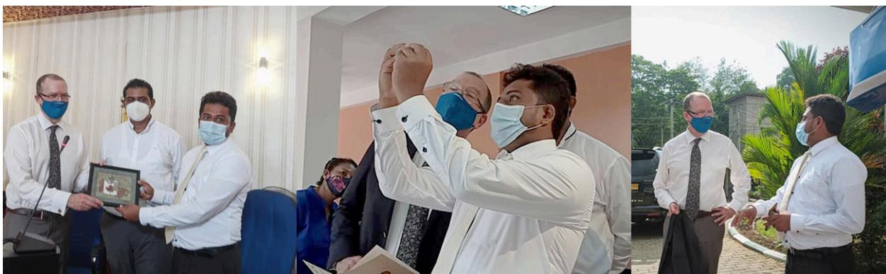
GEMCITY PROJECT DISCUSSION WITH CANADIAN AMBASSADOR