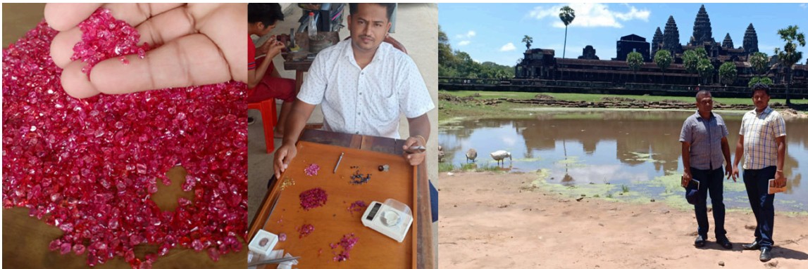
GEM EXPEDITIONS IN CAMBODIA