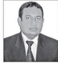
ဟောပြော ပတ်စပို့များ

අපේ ස්වර්ණ වෙනුවෙන් ඒ වඩා වැඩි ප්‍රමාණයක් නවා. ඒ පහසුකම් සැලැ ස්වනු ලබන ආයතනවල විවිධ ඉදිරිපසෙහි විවි ධයුක්තියක්.