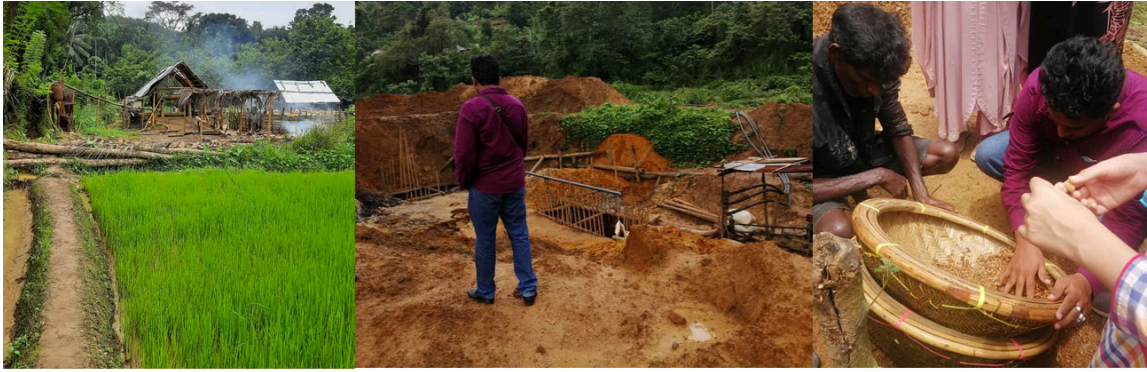
GEM MINING IN KAHAWATTA