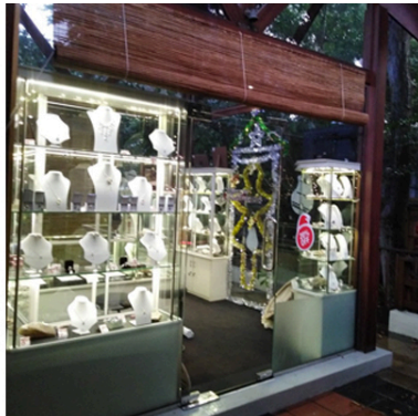
GEMLUCK AT GRAND UDAWALAWE SAFARI RESORT