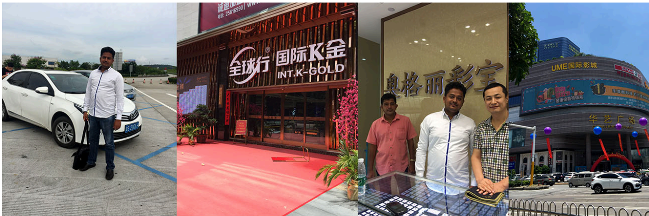
CHINA AND HONG KONG