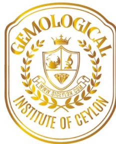
GEMOLOGICAL INSTITUTE OF CEYLON