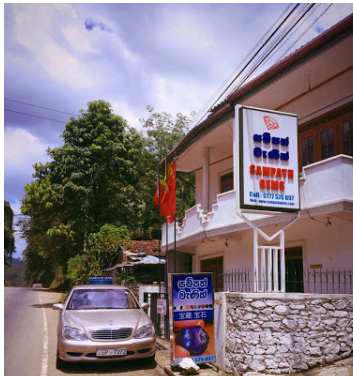
SAMPATH GEMS AND JEWELS KAHAWATTA