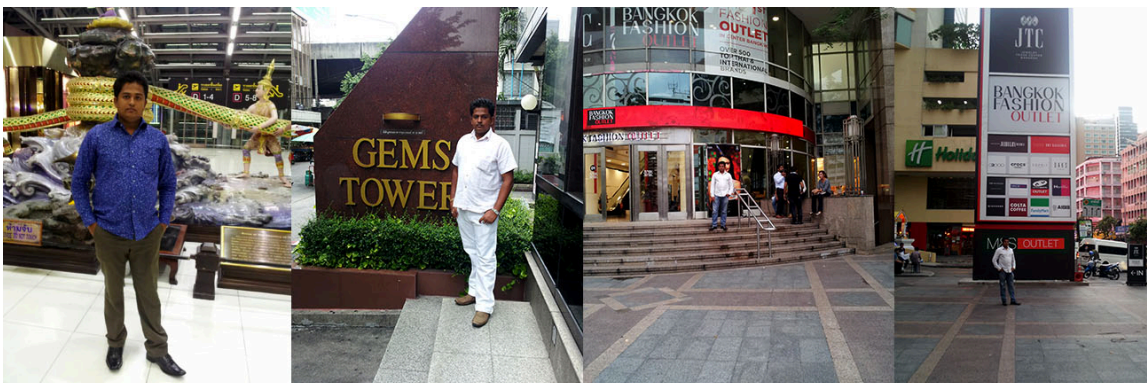
BANGKOK , THAILAND